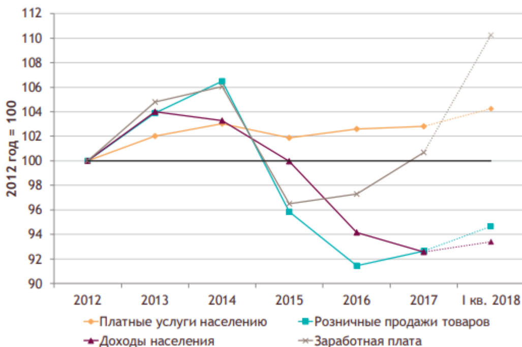
Рисунок 1 - Динамика реального объема платных услуг населению в годовом выражении (по оперативным данным Росстата*), 2012–2018 годы, %, 2012 год = 100[5]

В 2017 году реальный рост сектора платных услуг остался слабым, составив лишь 0,2%. В I квартале 2018 г. рост ускорился до 1,4% в годовом выражении (Рисунок 1).